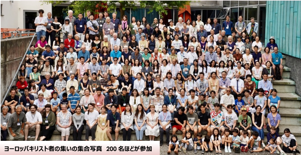
ヨーロッパキリスト者の集いの集合写真 200名ほどが参加