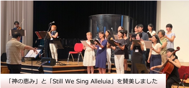
「神の恵み」と「Still We Sing Alleluia」を賛美しました

そして、今回久しぶりにお会いした方々や、初めての方と礼拝の会衆賛美と聖歌隊で賛美のご奉仕ができたことも喜びでした。短期集中型の練習時間ではありましたが、お一人おひとりの主への賛美の心を感じ、声を聴き、合わせることができたことはとても嬉しく、主への賛美の奥深さを学びました。