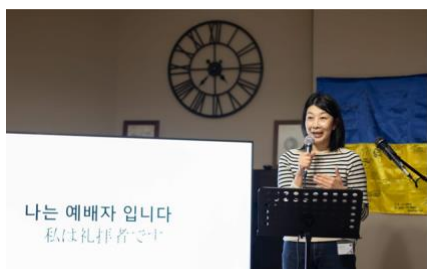
このセッションでは賛美教会の韓国人も参加され韓国語でも賛美をささげました