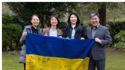
船越先生ご夫妻と一緒に